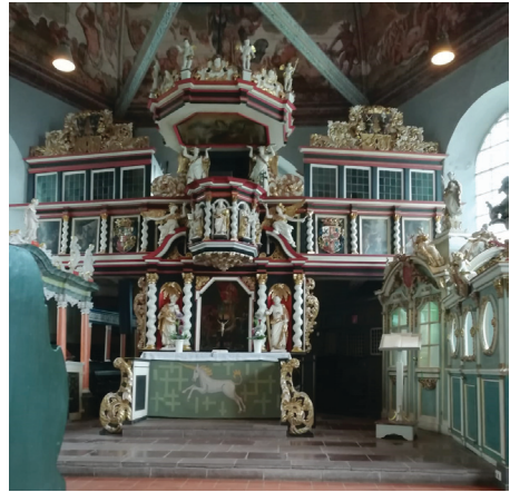
In der Kirche zu Neuenfelde

Apropos Deich: Unser Busfahrer fuhr uns direkt an die Wasserkante, und wir bewunderten die großen Pötte, die da draußen auf große Fahrt gehen. Und zu guter Letzt: trotz manchem Fernweh kamen alle wieder wohlbehalten nachhause.